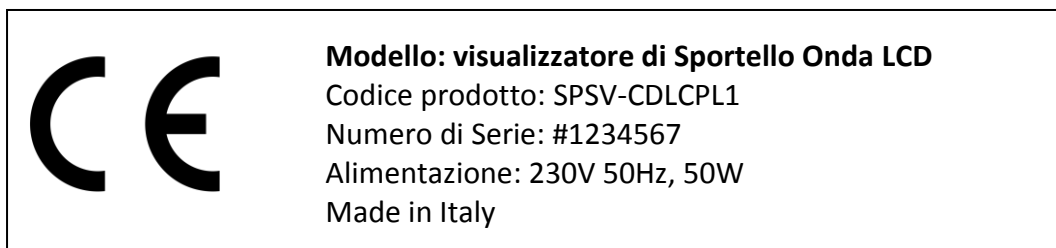
Fig.3.1 Esempio di etichetta ( i dati riportati sono puramente indicativi, i valori reali sono riportati nell'etichetta dell'apparecchiatura).

La targhetta fissata nella parte posteriore dell'apparecchiatura contiene tutti i dati identificativi del dispositivo stesso.